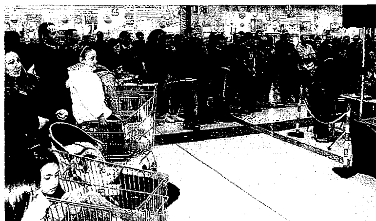
Shopping allietato dalla musica e band che incontrano il grande pubblico