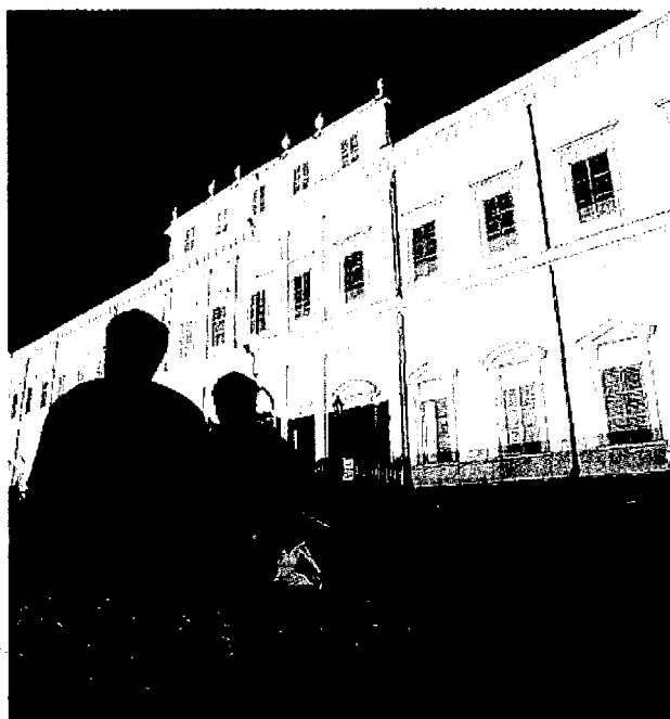
Facciate illuminate in modo surreale e musica con Andy: due giorni speciali