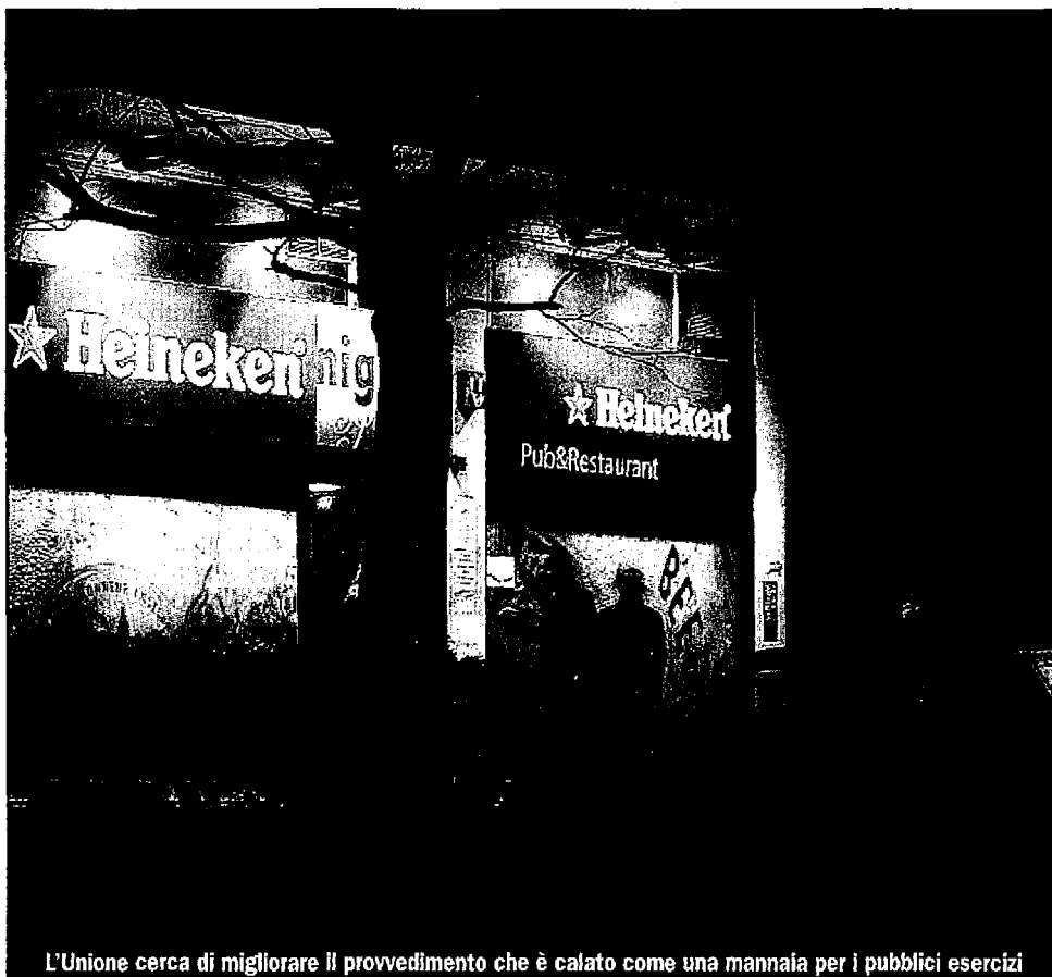
L'Unione cerca di migliorare il provvedimento che è calato come una mannaia per i pubblici esercizi

IL PRES DEI COMMERCianti E LA «VOCAZIONE TURISTICA» DELLA CITTÀ